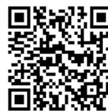
學生資訊帳號說明

學校各單位重要訊息除公告在處室網頁外，亦常寄送至學生校園 Gmail，請學生善加使用校園 Gmail 帳號，開通時間預計為開學當週，相關說明請參閱資網中心網頁。