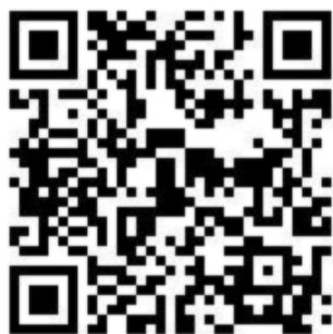
(高教深耕計畫-完善弱勢協助機制QR CODE)

學務處設置多項獎補助措施，以鼓勵弱勢學生強化專業學習、參與校園活動，並達協助學生安心就學之目標，請各位導師協助轉知班上具有下列五類身份學生至本校高教深耕網頁查看獎補助資訊並於110年9月28日前向課外組申請：(1)低收入、中低收入戶、(2)身心障礙學生或身心障礙人士子女、(3)特殊境遇家庭子女或孫子女、(4)原住民族學生、(5)獲教育部弱勢助學金補助學生、(6)懷孕學生及扶養未滿3歲子女之學生。